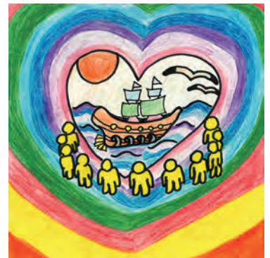
最優秀賞入賞作品