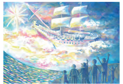
中学生の部 最優秀賞 「希望の光に向かって」