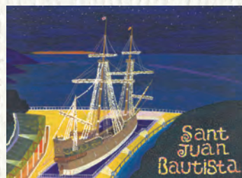
サンファンナイト

昭和22年(1947年)仙台市に生まれる。中学・高校と油絵を学び、グラフィックデザイン、コピーライター等を経て1993年仙台丸善にて個展をスタートして現在に至る。ふるさとの仙台の昭和を中心に、郷愁の画家として人気を博している。