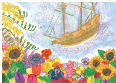
小学校高学年の部 最優秀賞 「サン・ファン・パウティスタ号を称えて」