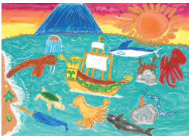
小学校低学年の部 最優秀賞 「楽しそうなサン・ファン・パウティスタ号」